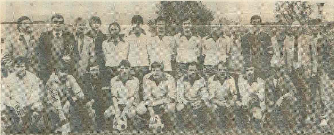
De nationale kampioenenploeg met afgevaardigden, vóór de aftrap nog een en al concentratie.

De Brugse selectie die de West-vlaamse eer moest hooghouden heeft haar campagne op dezelfde schitterende wijze te Hoboken afgesloten als ze die eerder tijdens de schiftingswedstrijden te Bokrijk had ingezet. Alles werd gewoon gewonnen en de manier waarop kan men uit de 13-1 goalaverage aflezen. Toch zeggen die riante eindcijfers niet alles, want ook in de finale bleef het tot een stuk in de tweede periode wachten op zekerheid. Eenmaal zover kon de Brugse vreugde niet op, ook al omdat uiterekend dit jaar het bedrijfsvoetbal in West-Vlaanderen aan haar zestigste verjaardag toe is! Een feestelijker taart, nota bene de eerste landelijke titel in haar bestaan, had men bezwaarlijk kunnen aanbieden.